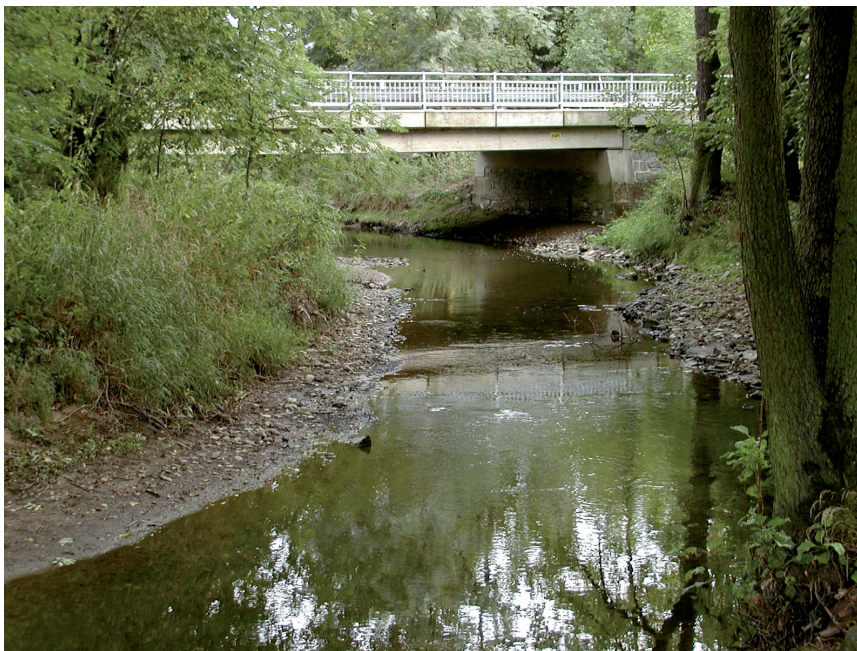
Most přes řeku Doubravu