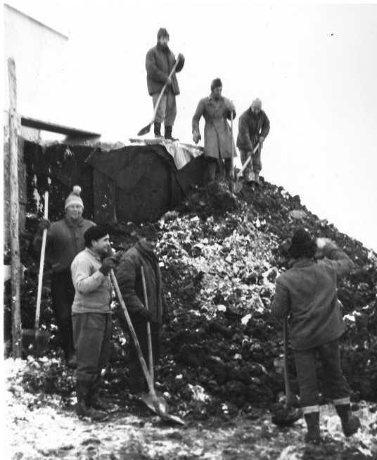
Stavba vodovodu v letech 1974–1976