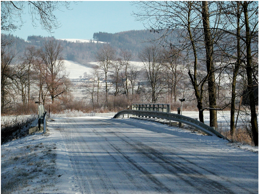
Most přes Doubravu s pozadím Dolní Lhotky a Železných hor