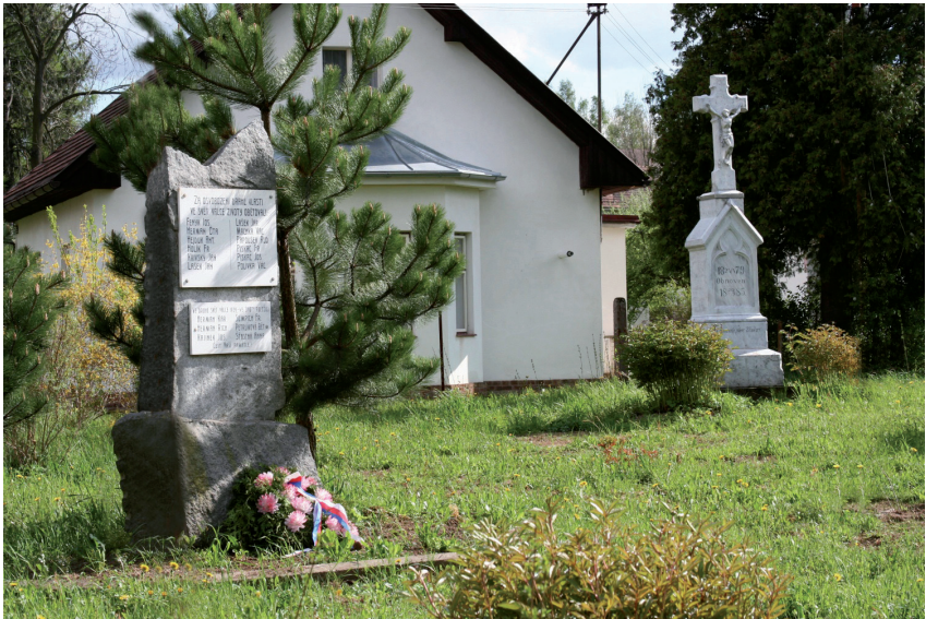
Památník obětem 1. a 2. světové války a kamenný kříž z roku 1879