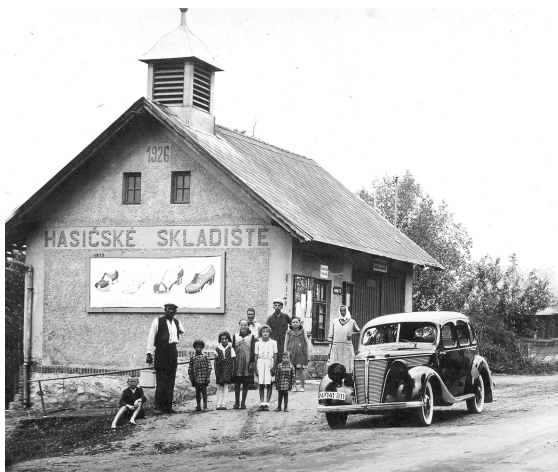
Hasičská zbrojnice – dobová fotografie