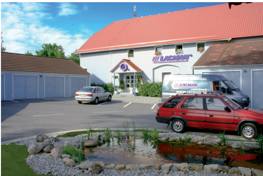
Firma Lacman (spojovací materiál) – vchod a nádvoří před prodejním skladem