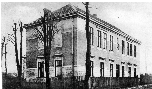
Základní škola ve Vísce po přestavbě z roku 1912

Historie mateřské školy ve Vísce začíná školním rokem 1962-63, kdy do