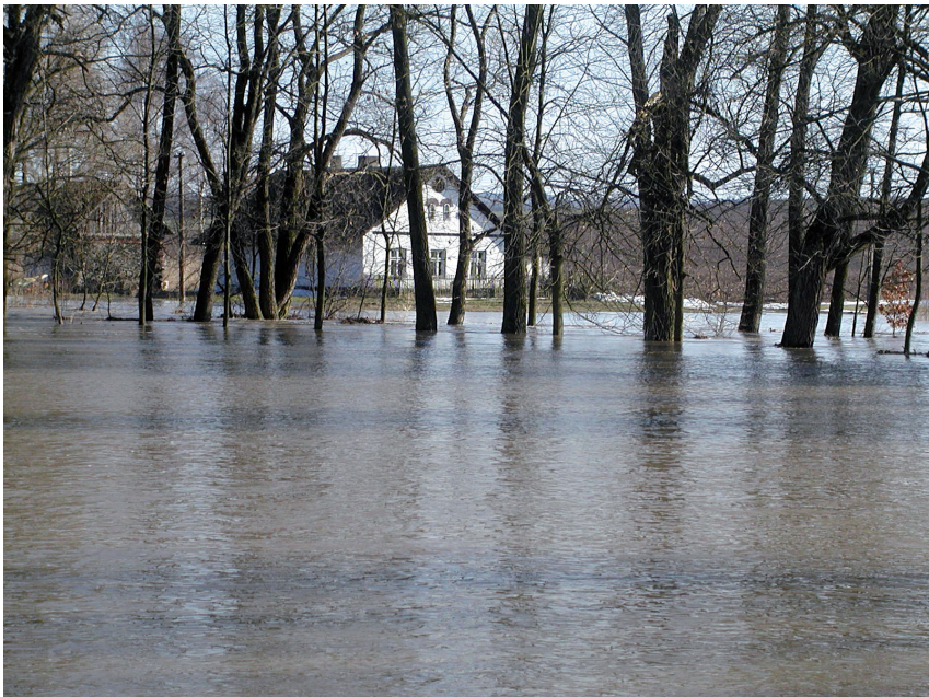
Jarní povodeň ve Visce v roce 2005