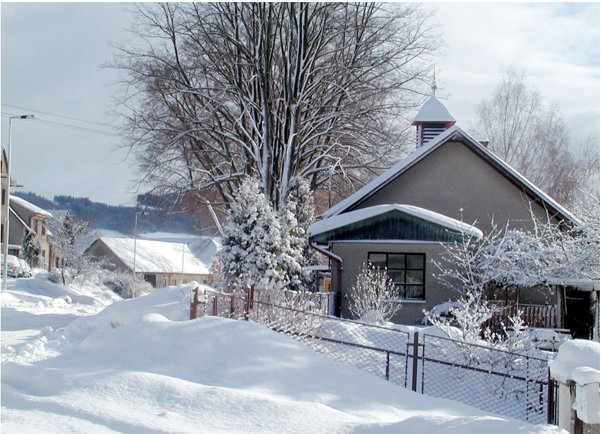
Současná hasičská zbrojnice s čekárnou u zastávky autobusu