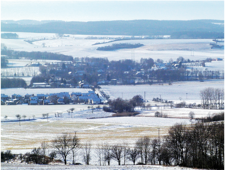
Zimní pohled ze Železných hor, v popředí obec Maleč