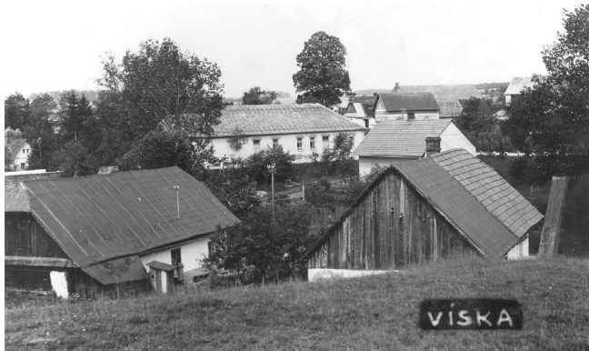
Historická pohlednice Víska – pohled od tehdejšího Dvora

Obec Víska má z hlediska správního poměrně pestrou historii. Již od dob středověku byla se svým okolím součástí kraje čáslavského. Správu tady vykonával vrchnostenský úřad malečského panství, k němuž obec patřila od poloviny 17. století.