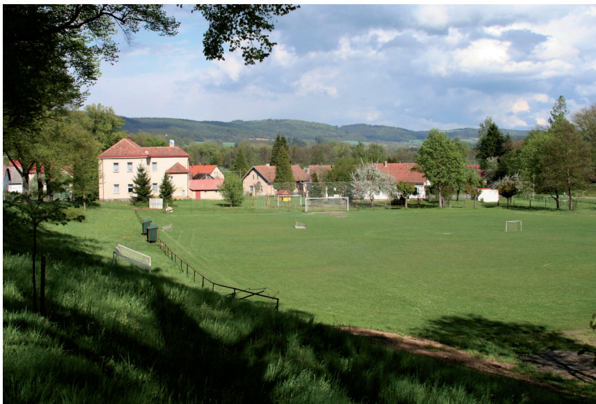
Fotbalové hřiště, v pozadí budova MŠ Viska a Železné hory