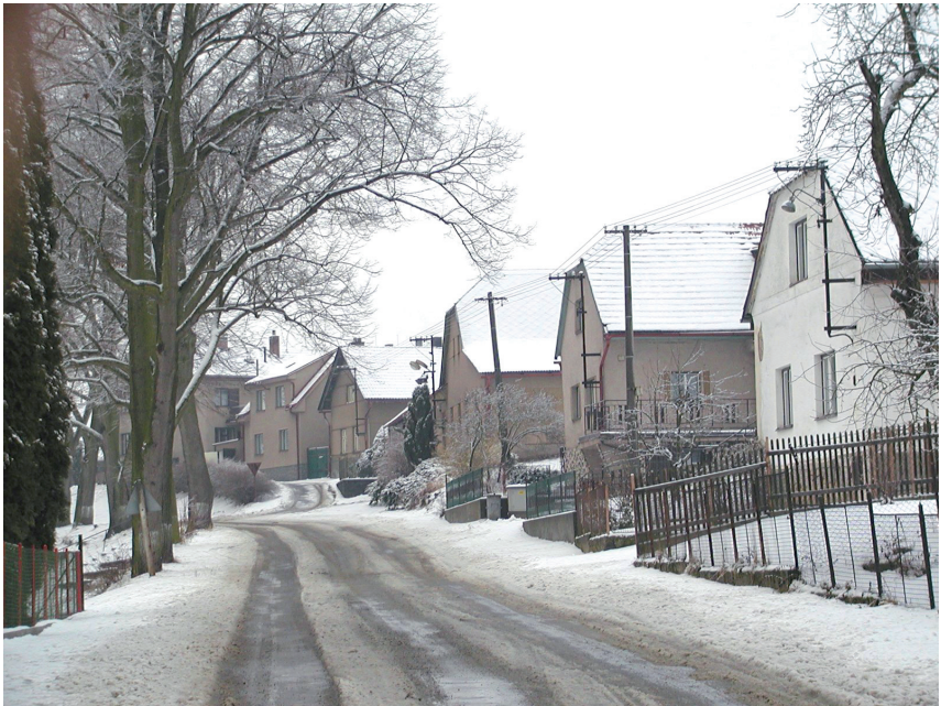
Zasněžená vesnice – pohled od mateřské školy