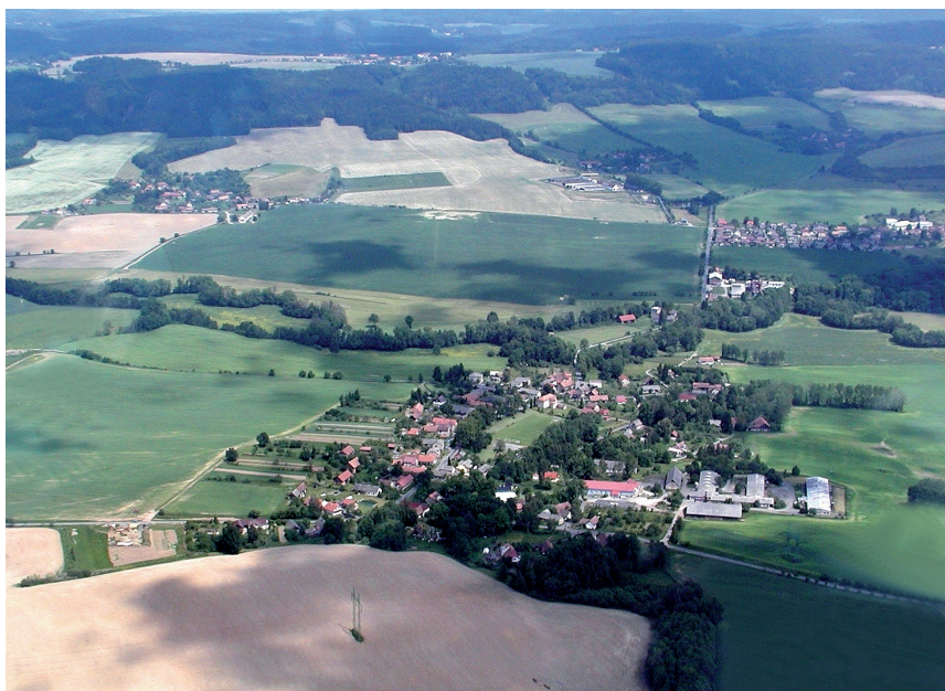
Letecký snímek obce, v pozadí Maleč a Lhotky, vlevo Čečkovice, nahoře Klokočov