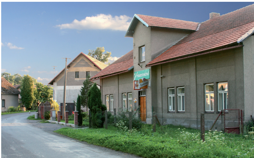
Hostinec u Fajmanů