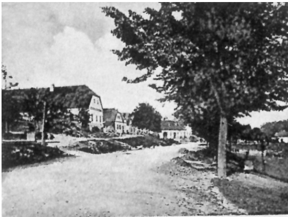
Pohled na lipovou alej, v pozadí hostinec a obchod u Hermanů

historicky nejvyšší počet lidí, kteří v této obci trvale žili.