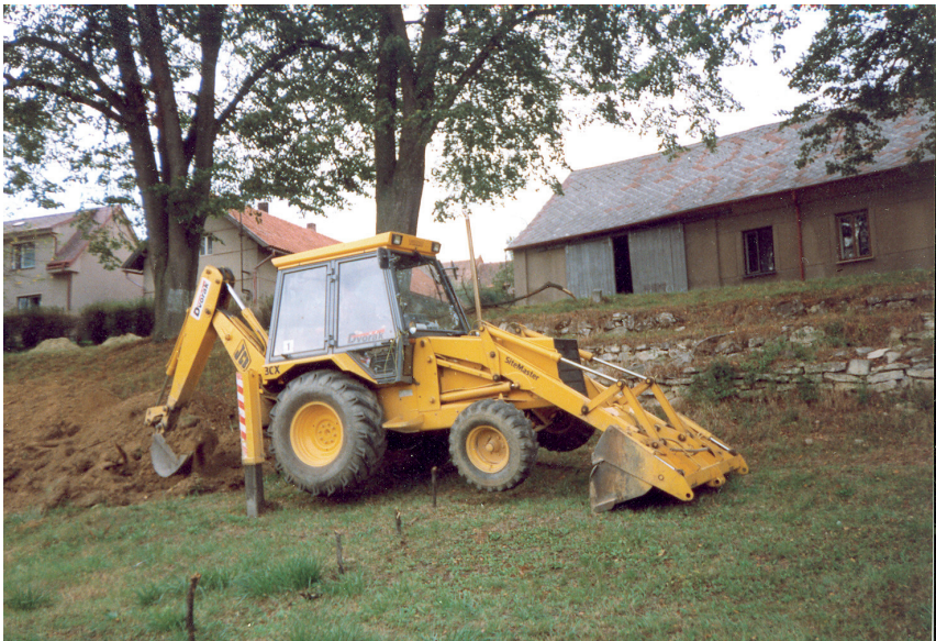
Plynofikace obce – zdolávání svahu nad hřištěm