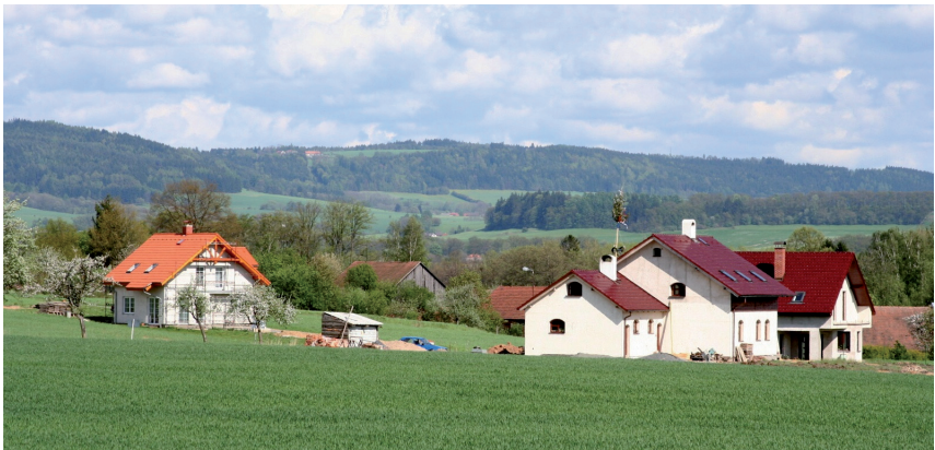
Pohled na západní část obce s novostavbami