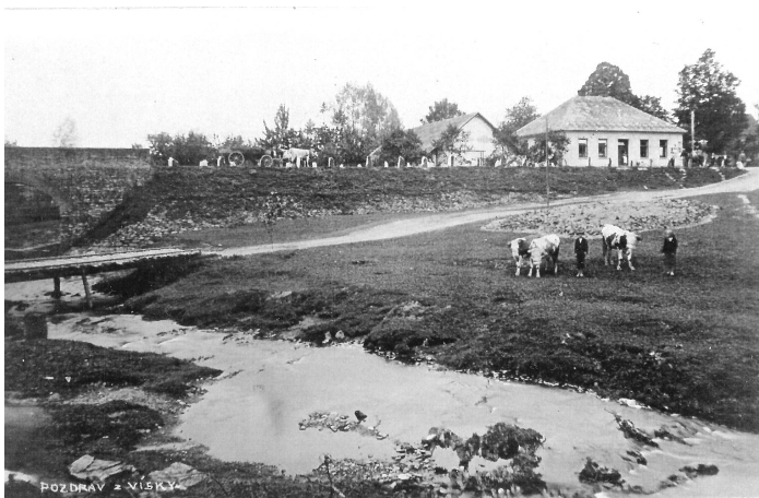
Potok před regulací v roce 1930, v pozadí obchod u Březinů

Prvá léta dvacátého století probíhala vcelku poklidně, bez mimořádných politických a společenských otřesů. I při běžných starostech začaly se rozvíjet kulturní akce, první ochotnická představení a zábavy. Velkým počinem občanů Visky bylo postavení nové přizemní školní budovy na okraji obecního pastviště uprostřed obce v roce 1901 a její přístavba v roce 1911.