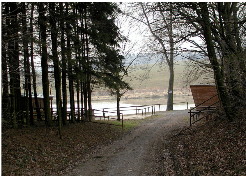
Přijezd k rybníku Společný s parketem a rybářskou chatou