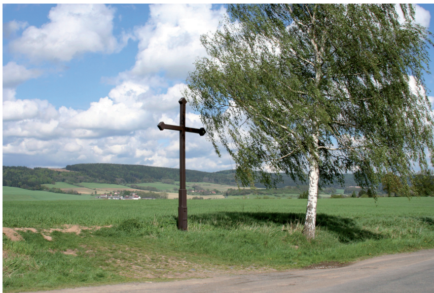
Kříž za obcí – obnoven v roce 1999