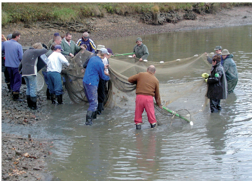
Podzimní výlov rybníku Společný