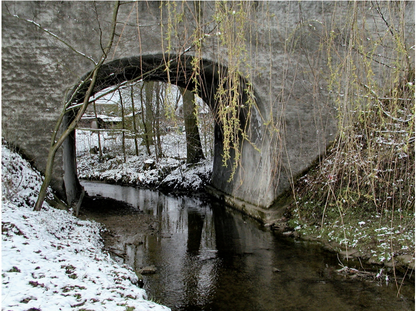
Kamenný most přes Novoveský potok