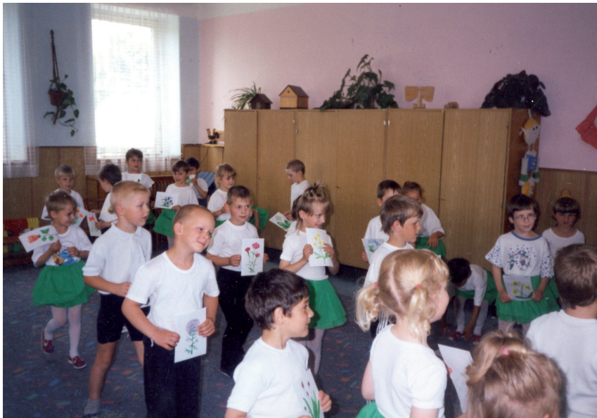
Besídka dětí z mateřské školy