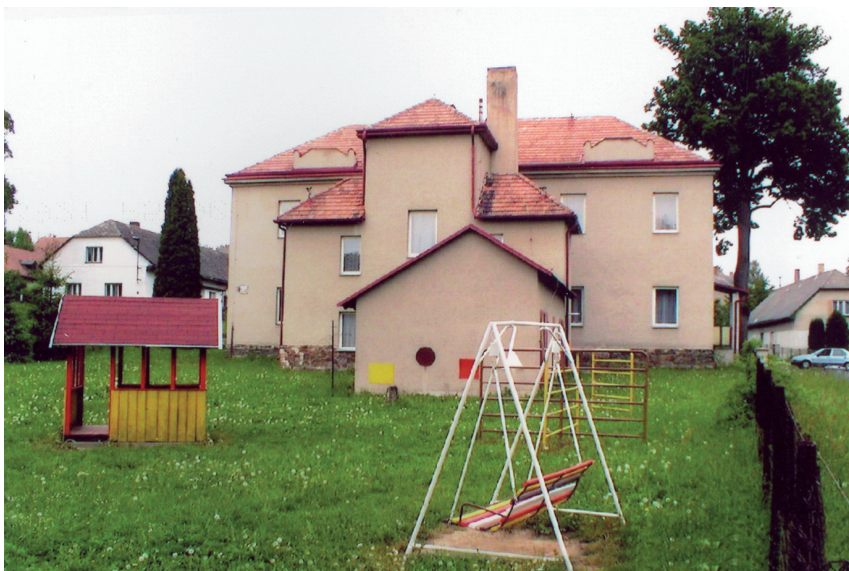
Současná MŠ se zahradou