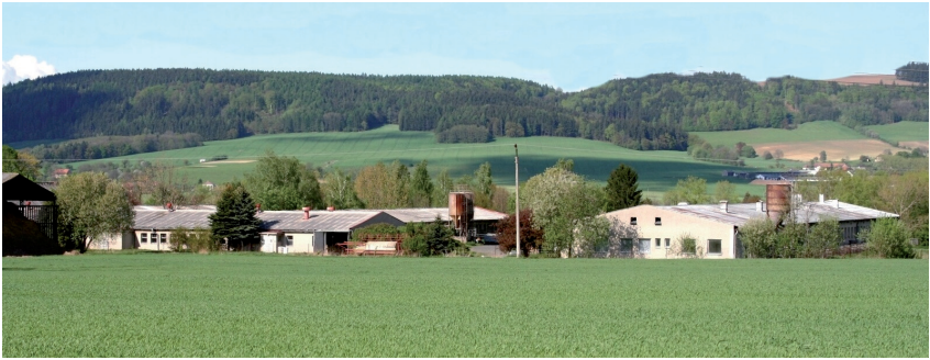
Objekt živočišné výroby ZD Nová Ves-Viška