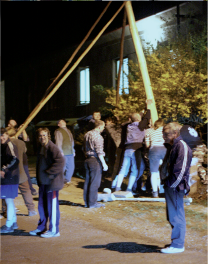
Udržování tradic v obci