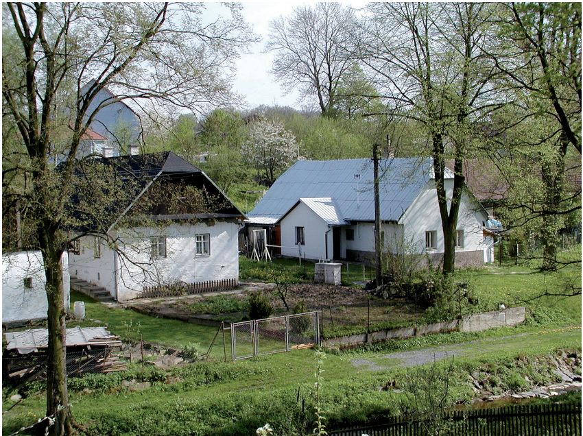
Pohled na jihozápadní část obce za potokem