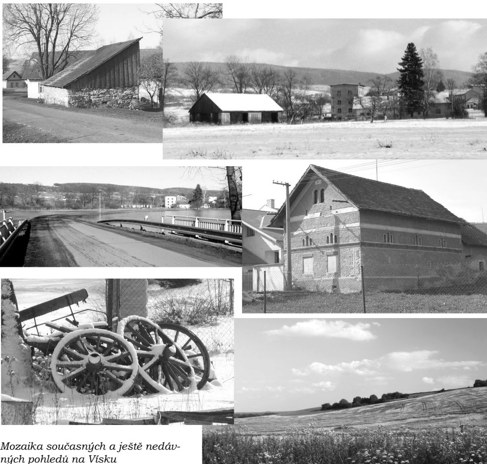
Mozaika současných a ještě nedávných pohledů na Vísku