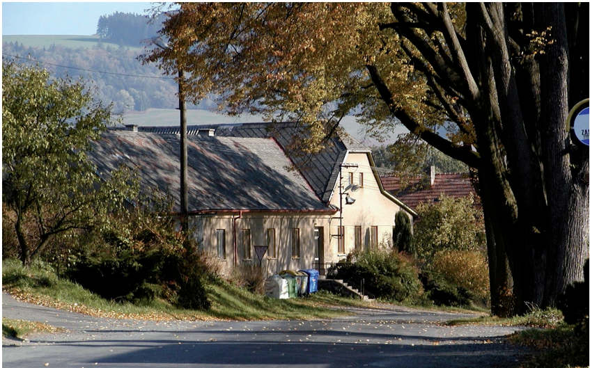
Budova TJ Sokol Viška