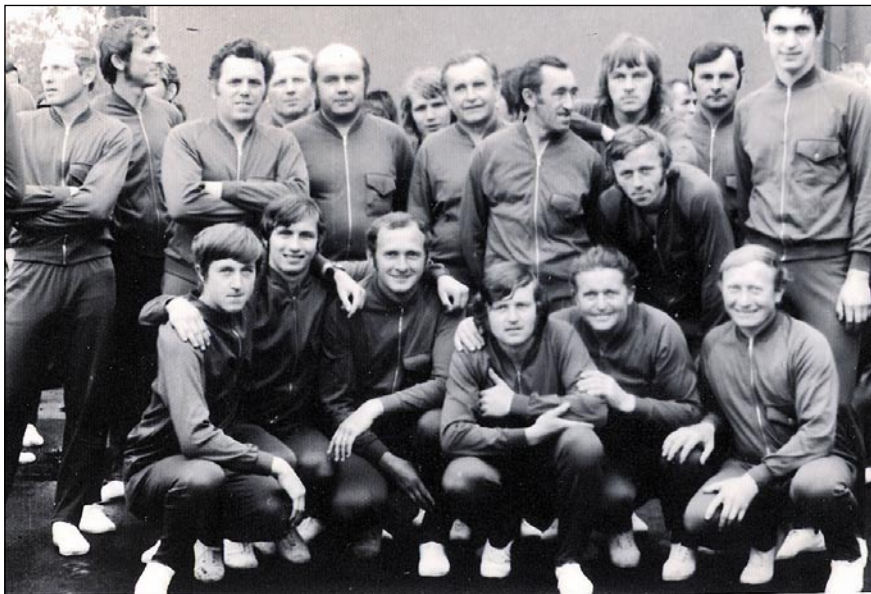
Muži z Visky a Nové Vsi při návčivku na spartakiádu