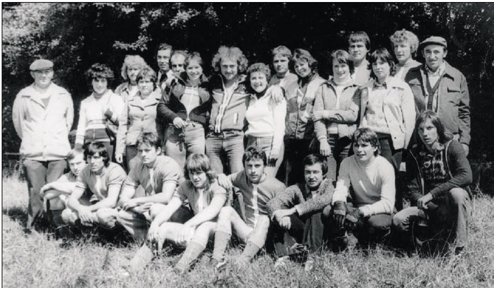
První zájezd do NDR