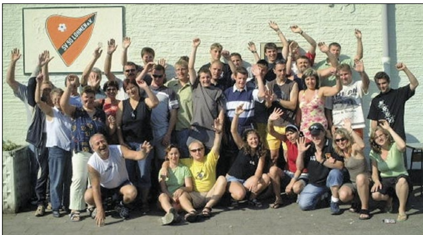
Na návštěvě u přátel z SV 90 Lomen (SRN) 2007