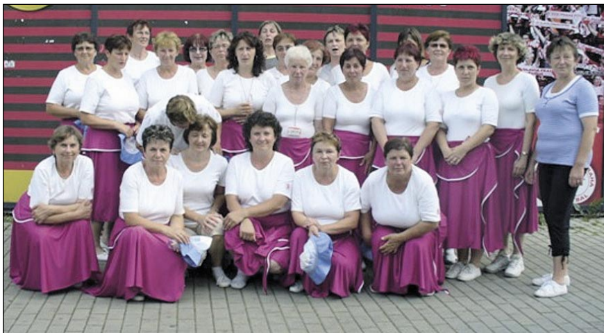
Ženy na sletech 2000 a 2012

Asi je na nás vidět, že roky přibývají. My se ale cvičení nevzdáme a budeme se těšit na další slety. Ten letošní jubilejní XV. si chceme užít a zacvičit si co nejvíce. Od roku 1990 patříme mezi „stálice“, které nikdy nevynechaly. Tak doufáme, že nám to vydrží. A věříme, že na dalších sokolských sletech se k nám přidají i mladší ženy, kterých ve Vísce naštěstí máme dostatek.