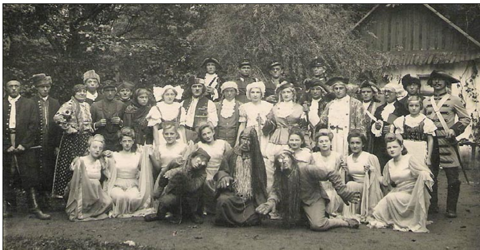
Ochotníci Sokola v představení Lucerna v roce 1940

Znovu byla obnovena i aktivní účast Sokola na společenském životě. Tak jako v meziválečném období sokolové připomínali různá výročí českých dějin (besídky 28. října, k výročí narození T. G. Masaryka, výročí Karla Havlíčka Borovského a další). Nechyběli na žádné důležité akci v obci, jakou například bylo odhalování památníku padlých v parčíku před školou v roce 1947. Společenské akce (jako například besídky, plesy či divadla) sloužily také jako zdroj příjmů a poválečná éra i díky nim byla jednou z mála, kdy jednota hospodařila s přebytkovými rozpočty a finance dokonce ukládala na vkladní knížky.