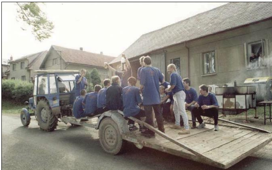
Vítězné mužstvo III. třídy okresu 2001 - oslavy postupu

členové postupového týmu, kouřící doutníky a oblečení do speciálních postupových triček, projeli obcí na plošině tažené traktorem zdraveni přihlížejícími.