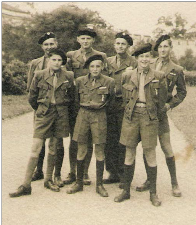
Dorostenci Sokola Maleč – Viska na všesokolském sletu 1948

Po návratu z Prahy ve zdejší jednotě začal rychle klesat počet do té doby pravidelných schůzí a také výrazně počet jejich účastníků. V listopadu oznamoval náčelník, že muži a dorost od léta dosud necvičí, ženské složky cvičí pouze ve Visce, žactvo cvičilo pouze třikrát. Krátily se zápisy ze schůzí, u správ činovníků je velmi často v zápise (na rozdíl od dřívějších let) – „nemá zpráv“, snad ještě častěji byli jednotliví