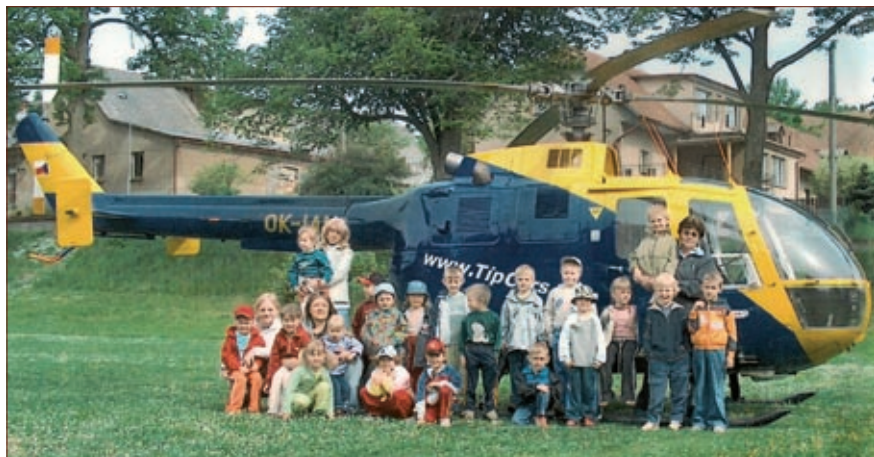
Děti MŠ při historickém přistání helikoptéry na víseckém hřišti