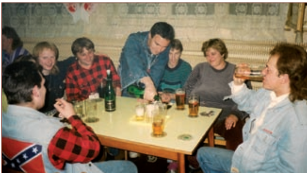
Podmanivá atmosféra Hostince u Fajmanů

Hospoda měla a má hodně co dočinění s fotbalem. Před zápasem se zde vedou úvahy, jak to asi bude vypadat, kdo podá mizerný výkon, jelikož byl