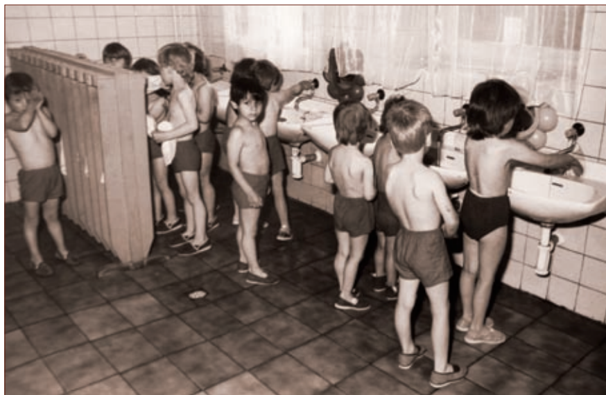
Již méně oblíbená hygiena před spaním v mateřské škole

Je to již 40 let, kdy jsem v březnu 1975 nastoupila do školky ve Vísece jako učitelka. Předtím jsem působila rok jako vychovatelka v Dětském domově v Nové Vsi u Chotěboře. Abych s předškolními dětmi mohla pracovat, musela jsem ještě v květnu dokončit další vzdělání. V tomtéž létě 1975 jsem byla jmenována do funkce ředitelky školky na návrh školní inspektorky Kuncové. Později jsem navíc vedla večerní cvičení dětí v sokolovně a působila ve