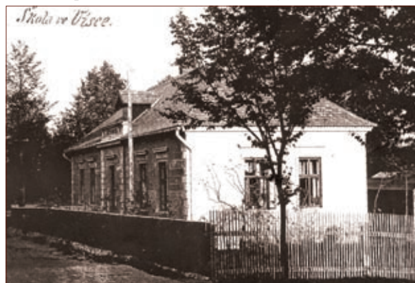
Škola ve Vísce do roku 1911

Jaký byl průběh školního roku ve Vísce až do doby první světové války? Škola zpravidla začínala v polovině září a učilo se do 31. července. Školní rok zahajovaly slavnostní bohoslužby v katolickém kostele v Heřmani. K jeho koloritu patřila každoroční oslava jmenin Jeho Výsosti císaře pána a jmenin