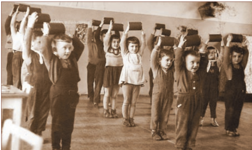
Hromadné cvičení dětí

školské komisi v Nové Vsi, pod níž tehdy Víška spadala. Přímo v budově školy byl volný služební byt, který byl mně a mé rodině přidělen, a tak jsem ve vísecké mateřské školce pracovala i bydlela, a to až do srpna 1978, kdy jsme se odstěhovali do Havlíčkova Brodu.