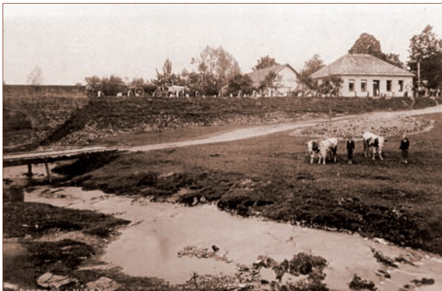
Pohled na potok, kamenný most a místo, kde byl později postaven domek rodiny Polívkovy, v pozadí obchod Václava Březiny