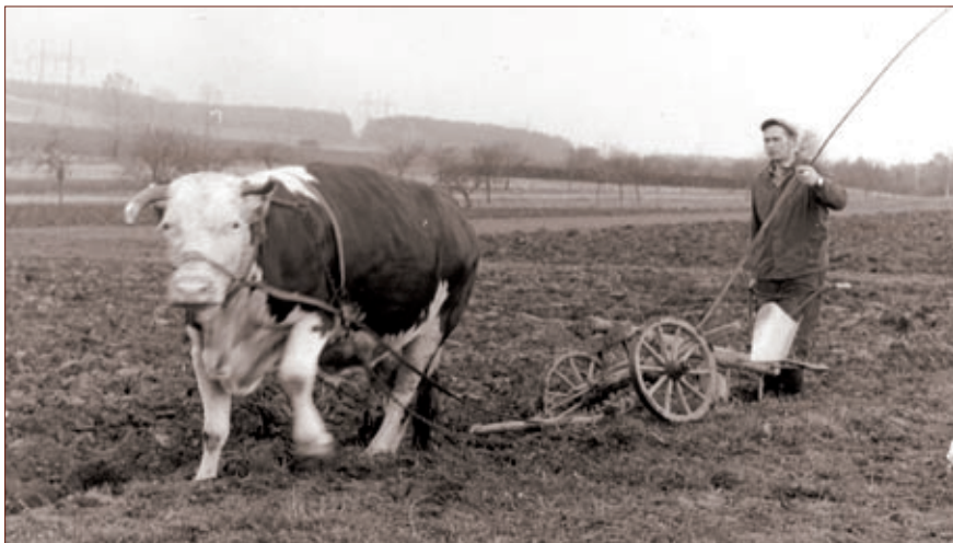
Samostatně hospodařící rolník Antonín Papoušek při orbě

ky, chlebové placičky a různé figurky. Chleba se pekl asi ze 30 kg mouky každých 10 až 14 dní. Byl pro dvě rodiny, dělili se o něj i další příbuzní a známí. Recept je naprosto jednoduchý, jen zadělat, upéct a můžeme jíst. Jenže ta pec je již zbouraná.