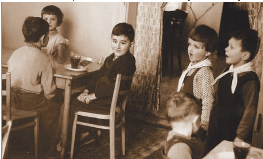
Na počátku šedesátých let byla vybudována jídelna

Začátky nebyly jednoduché, přestože jsem teorii ovládala a snažila jsem se čerpat z různých odborných knih a příruček. Když vzpomínám na léta své praxe dnes, defilují přede mnou řady dětí a já moc lituji, že jsem si nezapsala každým rokem, kolik dětí jsem učila. Myslím si, že by to byla úctyhodná řádka jmen. Logopedická práce je velmi krásná, ale značně obtížná. Když jsem učila správnou výslovnost asi třetím rokem, dlouho se mi nedařilo naučit jednu holčičku hláске ř. Začala jsem zvažovat možnost, že s touto prací skončím, protože