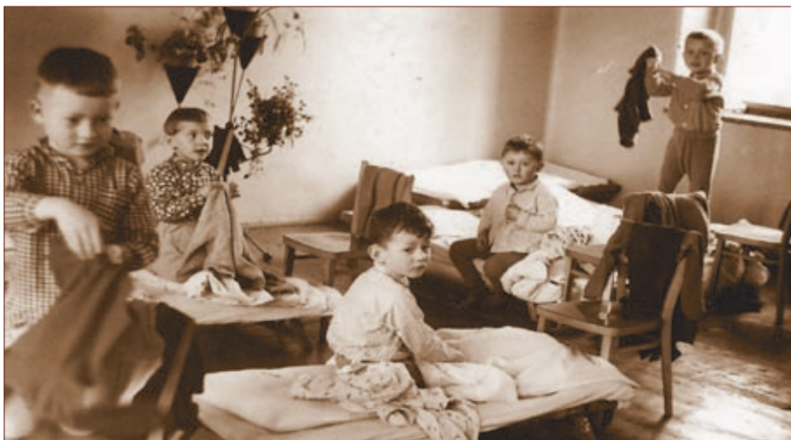
Polední siesta skončila...