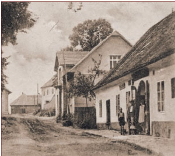
Škola v Heřmani

V druhé polovině 19. století heřmaňská škola po těžších začátcích postupně vzkvétala a rozšiřovala se. Školní kronika znamená, že v roce 1883 došlo k přestavbě školy poté, co byla rozšířena na trojtřídní. Jako důvod připojení nové třídy uvádí, že zde studovalo po více let na 250 žáků a často i více. Lepšila se i školní docházka, škola získala postupně zahradu osázenou ovocnými stromy a s ní i prostor pro venkovní tělocviki.