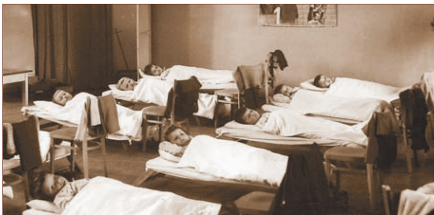
Často vzpomínaná polední siesta v mateřské škole