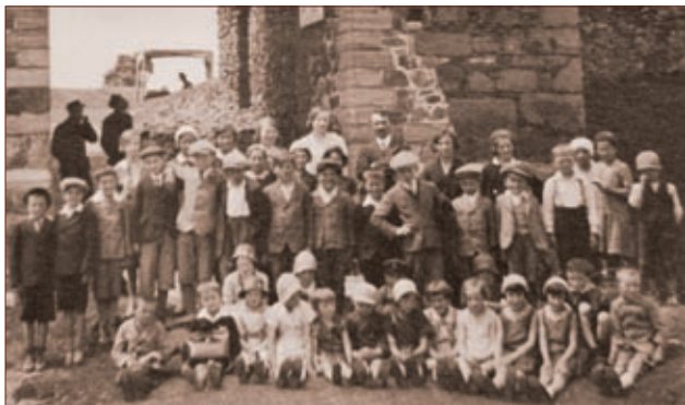
Školní výlet na Lichnici ve třicátých letech