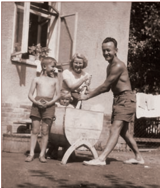
Dobová „automatická pračka“ – autor se sestrou a rodiči

Přes obrovský technologický pokrok ve všech možných odvětvích v posledních 20–30 letech není vše jen růžové. Nikdy by mě před šedesáti lety nenapadlo, jak bude vypadat potok, kde jsme se jako děti koupali a dělali u něj ranní hygienu, tzn. mytí a čištění zubů. Voda byla průzračná a plná různých ryb. Byly to vždy nádherné prázdniny, strašně neradi jsme na jejich konci odjížděli do Prahy.