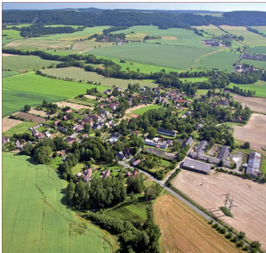
Obec Víska, 2015 ISBN 978-80-260-8722-9