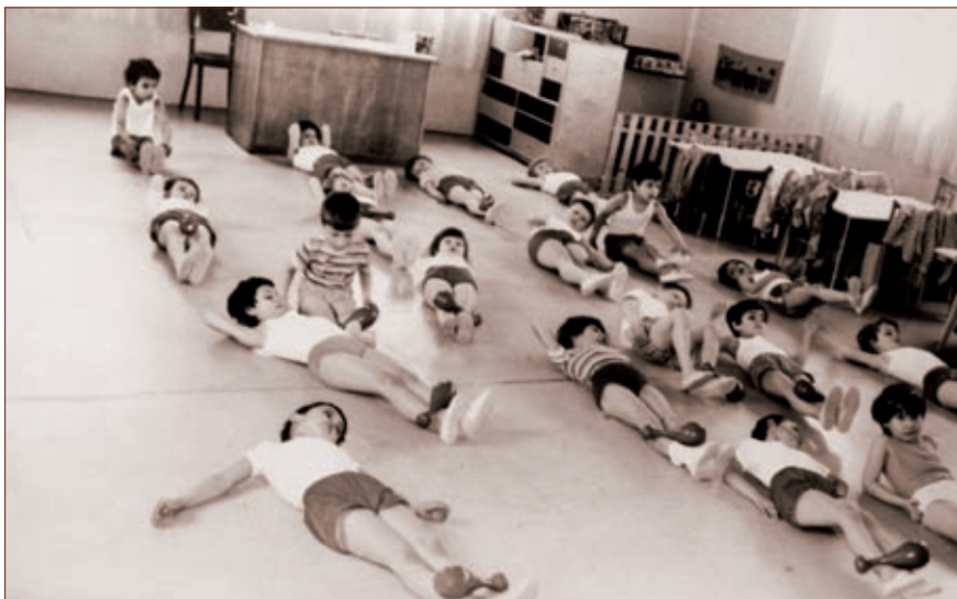
Oblíbené cvičení dětí ve třídě mateřské školy

omšele. Některá okna nedoléhala, některá jsme raději neotvíraly. Neustále jsme řešily drobné stavební úpravy. Tu odpadl kus omítky, tam se objevila další díra od myši, někdy netekla voda, jindy netáhla kamna, občas upadla noha od stolku nebo odpadly dveře od skříně s hračkami. Hlavně ty dveře vy- padávaly tak často, že už časem nešly opravit. Naučily jsme se spoléhat samy na sebe a neustále jsme vymýšlely nové a nové dekorace a pomůcky, abychom to kolem sebe měly hezké. Časem jsme se dočkaly nových záclon a závěsů za peníze, které nám darovalo JZD, a také nového povlečení na lehátka.